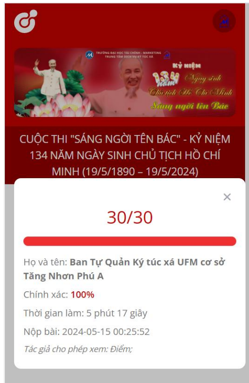
Hình 1. Ảnh mẫu chụp minh chứng kết quả cuộc thi trên giao diện điện thoại